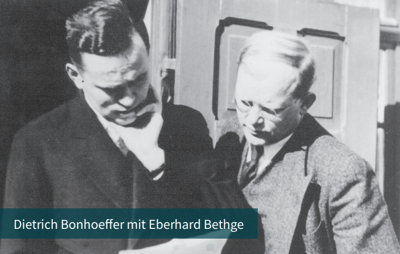
Dietrich Bonhoeffer mit Eberhard Bethge