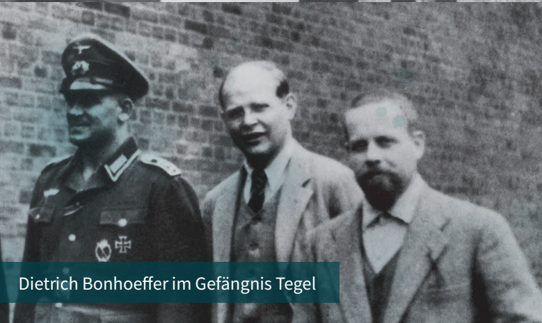
Dietrich Bonhoeffer im Gefängnis Tegel