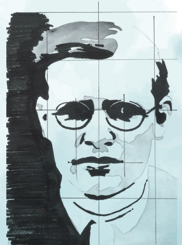
Illustration: Brittney Dunn / Wheaton Magazine, Wheaton College (IL)

Internationale Bonhoeffer-Gesellschaft Deutschsprachige Sektion e.V.