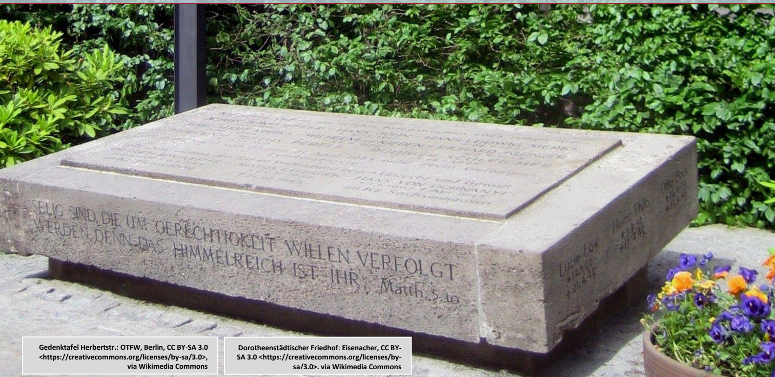
Gedenktafel Herbertstr.